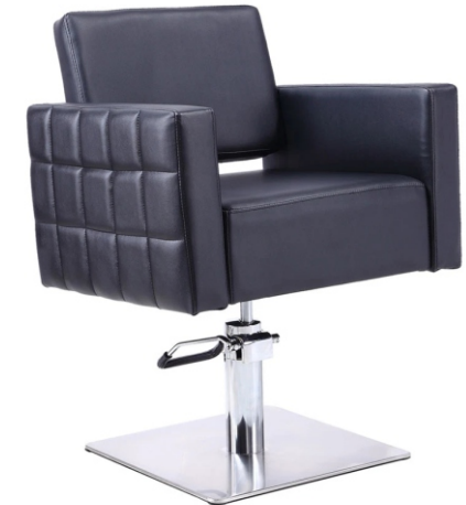
Friseurstuhl Coiffeur-Stuhl Panna