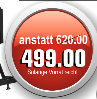
Coiffeurstuhl Moderna schwarz Artikelnr.: A- 148058

Coiffeur - Friseurstuhl Hair System Budget schwarz A-147831 inkl. Höhenverstellung